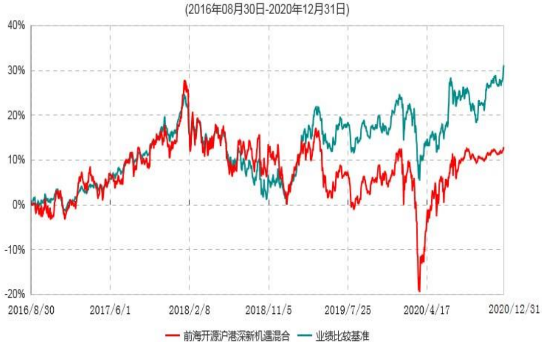
前海开源沪港深新机遇灵活配置混合型证券投资基金累计净值增长率与业绩比较基准收益率历史走势对比图