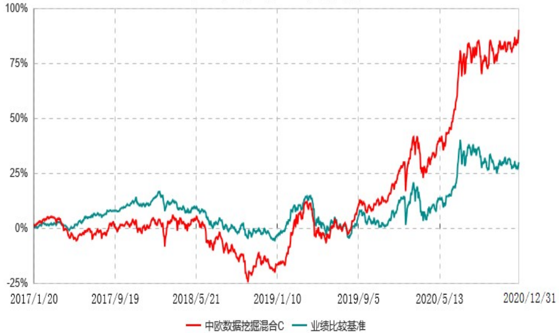
中欧数据挖掘混合C累计净值增长率与业绩比较基准收益率历史走势对比图 (2017年01月20日-2020年12月31日)

注：注：2019年4月26日组合业绩比较基准由沪深300指数收益率*60%+中债综合指数收益率*40%变更为中证500指数收益率*95%+中债综合指数收益率*5%。自2017年1月19日起本基金增加C类份额，图示日期为2017年1月20日至2020年12月31日。