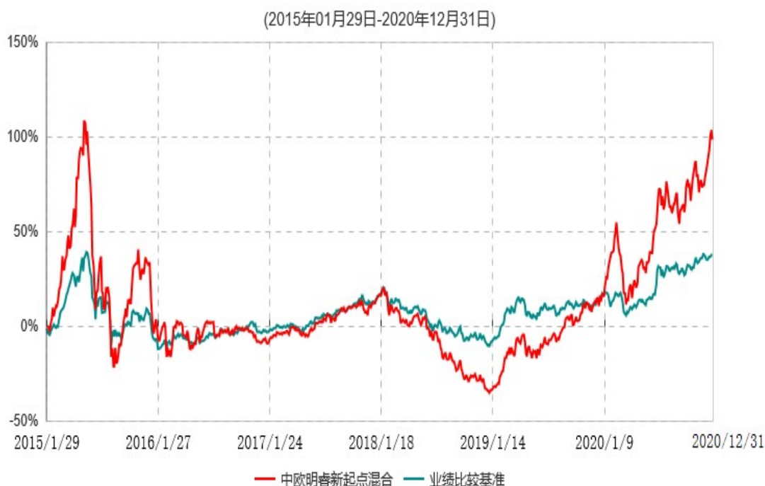
中欧明睿新起点混合型证券投资基金累计净值增长率与业绩比较基准收益率历史走势对比图