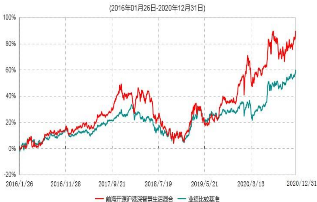
前海开源沪港深智慧生活优选灵活配置混合型证券投资基金累计净值增长率与业绩比较基准收益率历史走势对比图