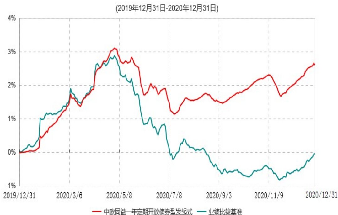
中欧同益一年定期开放债券型发起式证券投资基金累计净值增长率与业绩比较基准收益率历史走势对比图

注：本基金基金合同生效日期为2019年12月31日，按基金合同的规定，本基金自基金合同生效起六个月为建仓期，建仓期结束时各项资产配置比例已符合基金合同约定。