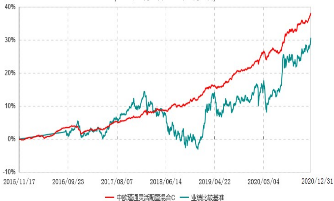
中欧瑾通灵活配置混合C累计净值增长率与业绩比较基准收益率历史走势对比图 (2015年11月17日-2020年12月31日)

注：自 2016 年 9 月 5 日起，变更业绩比较基准至沪深 300 指数收益率*50%+中债综合指数收益率*50%。