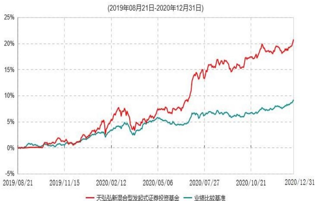
天弘弘新混合型发起式证券投资基金累计净值增长率与业绩比较基准收益率历史走势对比图