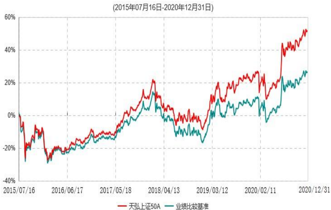
天弘上证50A累计净值增长率与业绩比较基准收益率历史走势对比图