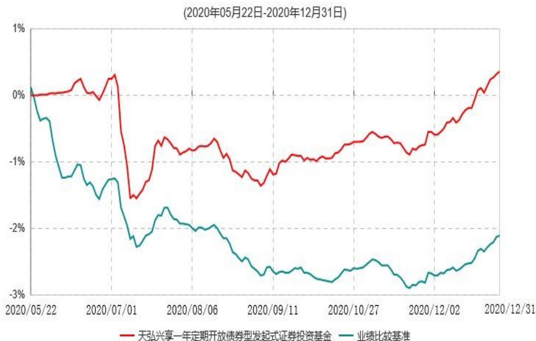
天弘兴享一年定期开放债券型发起式证券投资基金累计净值增长率与业绩比较基准收益率历史走势对比图

注：1、本基金合同于2020年05月22日生效，本基金合同生效起至披露时点不满1年。