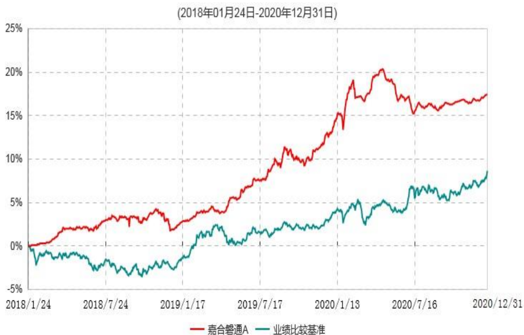
嘉合磐通A累计净值增长率与业绩比较基准收益率历史走势对比图