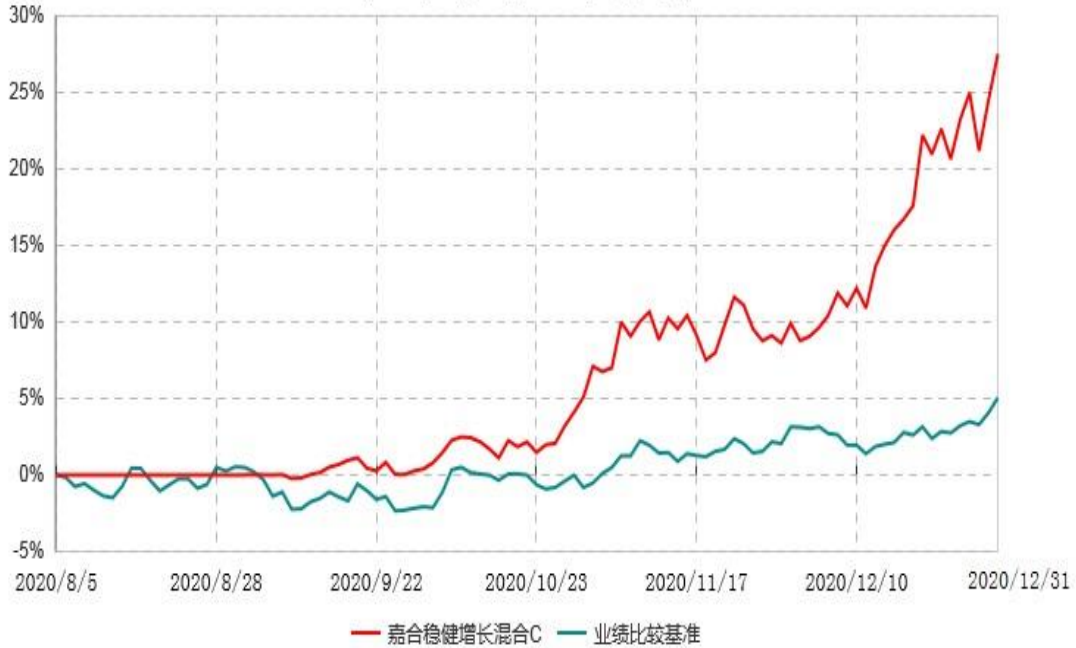
嘉合稳健增长混合C累计净值增长率与业绩比较基准收益率历史走势对比图 (2020年08月05日-2020年12月31日)

注：1、本基金基金合同于 2020 年 08 月 05 日生效。截至本报告期末，本基金基金合同生效不满一年。 2、本基金基金合同于 2020 年 08 月 05 日生效，按照基金合同规定，本基金建仓期为基金合同生效之日起 6 个月。