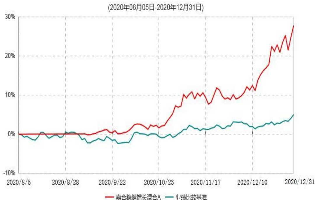
嘉合稳健增长混合A累计净值增长率与业绩比较基准收益率历史走势对比图

注：1、本基金基金合同于 2020 年 08 月 05 日生效。截至本报告期末，本基金基金合同生效不满一年。