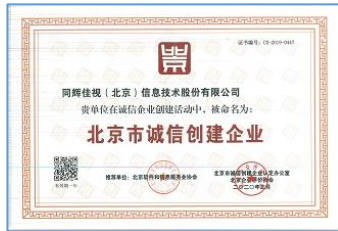
获得北京市诚信创建企业证书