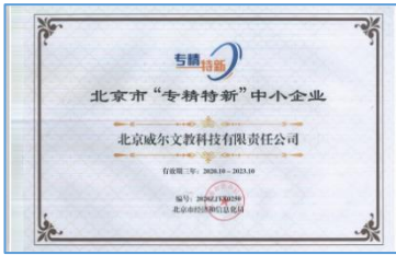
获得北京市专精特新中小企业证书