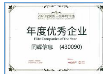
获得 2020 北京软件企业核心竞争力评价(规模型)奖、5G VR 云应用创新企业奖、年度优秀企业奖