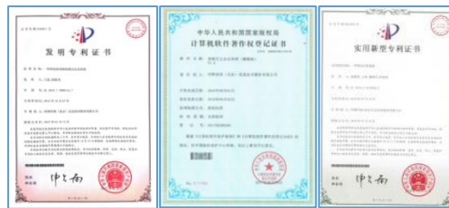
新增知识产权 30 项（实用新型专利 2 项，外观 1 项，软著 27 项）