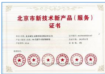
获得北京市新技术新产品(服务)证书