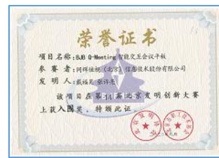
获得第14届发明创新大赛入围奖