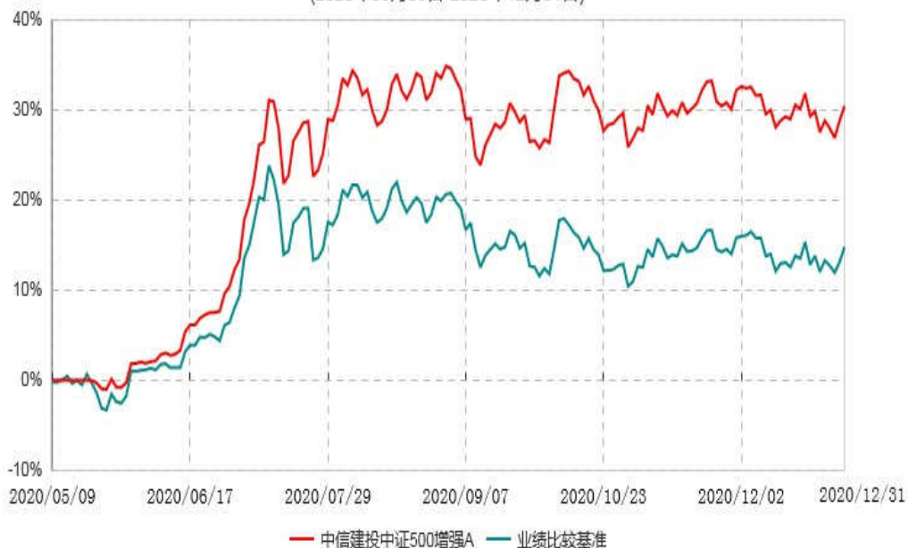
中信建投中证500增强C累计净值增长率与业绩比较基准收益率历史走势对比图