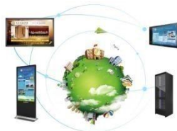
鸿合校园数字媒体发布系统