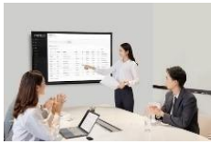
智能会议室解决方案

除此之外，“newline”还研发了高职教解决方案、金融解决方案、智慧医疗解决方案、党建解决方案等，满足不同行业客户的需求。