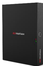
鸿合精品录播（5G便携录播）