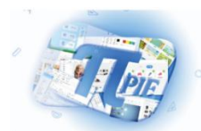
鸿合 \pi 交互教学软件