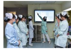
智慧医疗解决方案