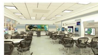
鸿合小组协作型教室解决方案