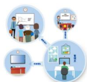
鸿合集中控制管理平台

除此之外，鸿合集中控制管理平台 and 鸿合幼教软件使用用户众多，得到了广大学校和师生的好评。