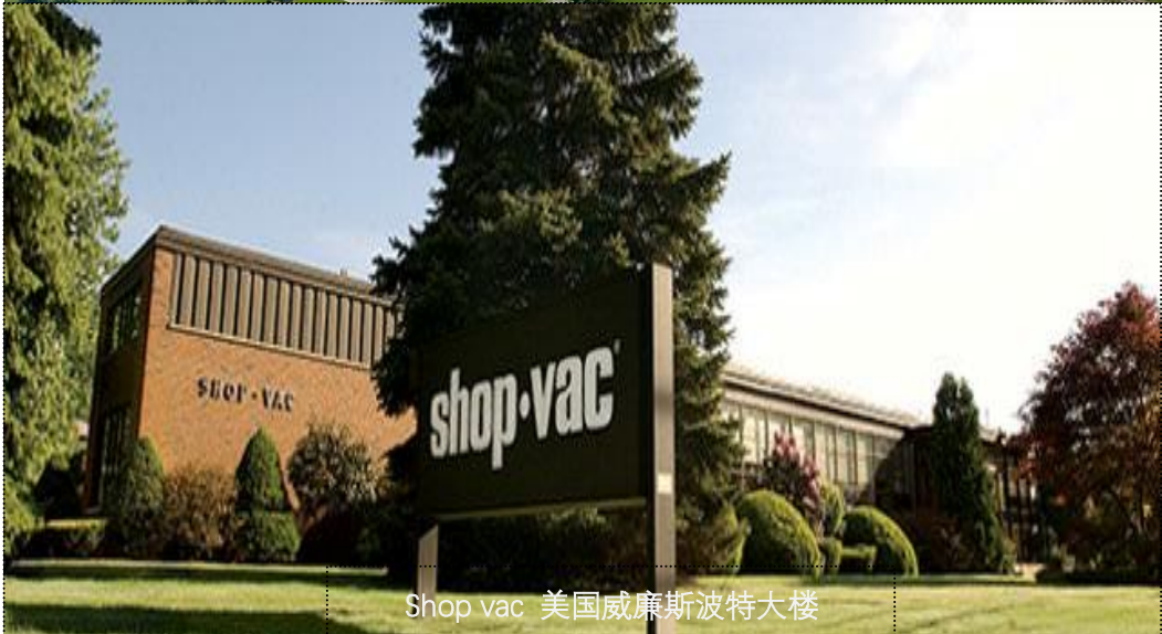
Shop vac 美国威廉斯波特大楼