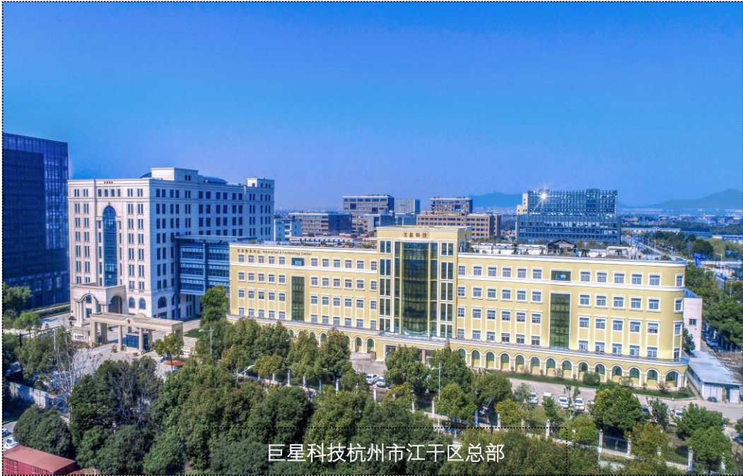
巨星科技杭州市江干区总部