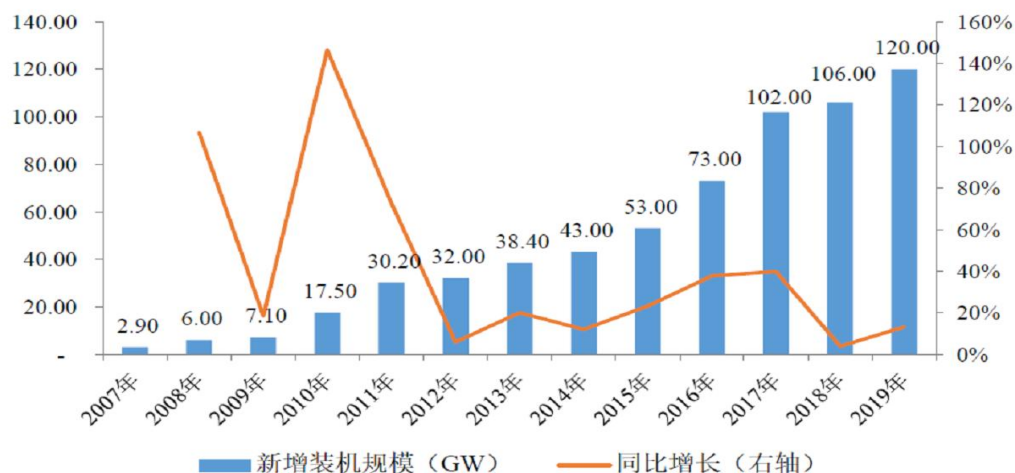
2007 年至 2019 年全球光伏新增装机容量变化情况