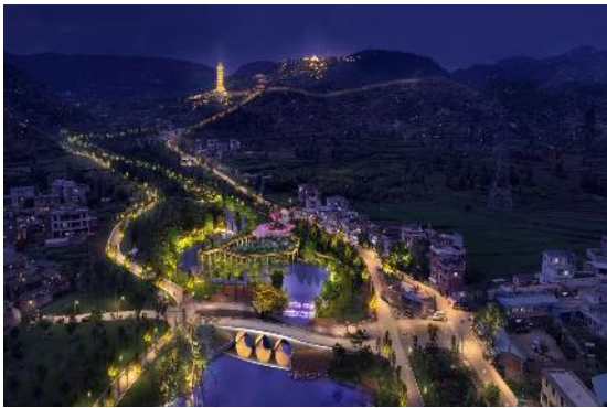
弥勒市甸溪河一期智慧夜游项目设计施工总承包 (EPC)