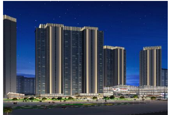
(武汉) 新建文化设施、居住、公园绿地项目 (7A、7B、8B 号地块) 泛光照明工程