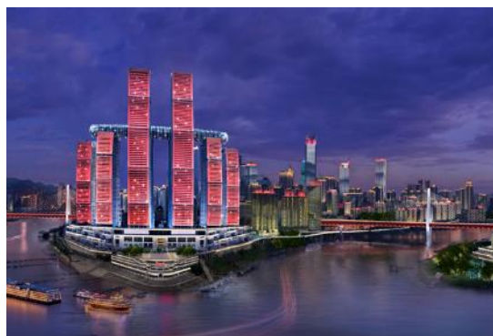
重庆主城区“两江四岸”文旅项目--夜市开灯仪式工程三标段