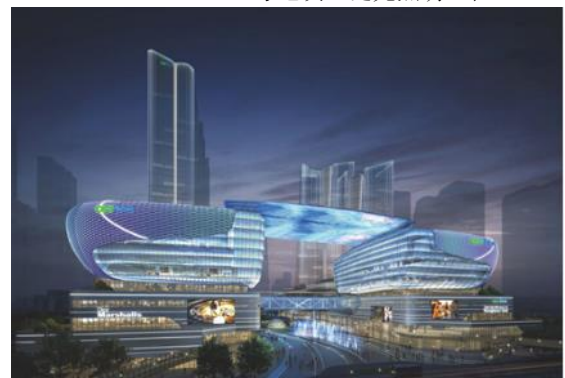
(武汉) 新建商务、商业设施、绿地与广场项目 (杨春湖启动区 A 地块) (南区/北区) 一期裙楼泛光照明分包工程