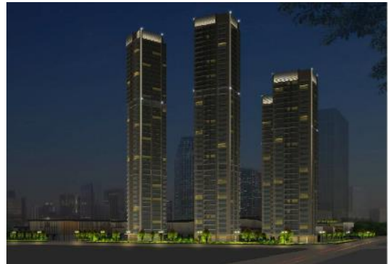
(深圳) 深国际前海颐湾府泛光照明工程