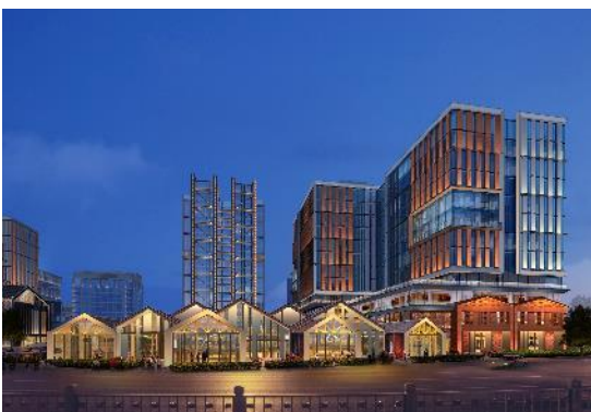
(北京) 新首钢国际人才社区(核心区南区) 项目建筑泛光照明设计