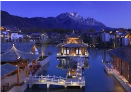
(北京) 雁柏山庄项目泛光照明工程