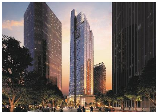
(深圳) 卫星通信运营大厦泛光照明工程