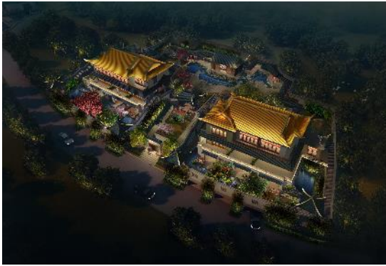
绵阳·大宝山“红叶东安湖体育公园一场三馆项目泛光照明承包工程谷巴蜀汉文化农耕民俗国际养生体验村”景观亮化工程