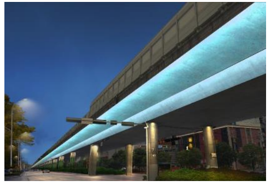
(荆州) 2020 年度市中心城区照明工程及 2019 年度中心城区路灯工程等建设项目总承包