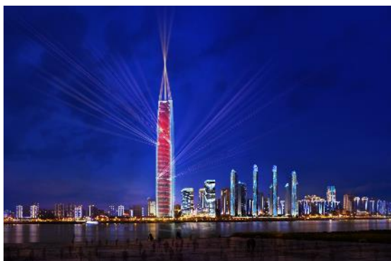
武汉绿地国际金融中心项目 A01-1 地块主楼 1#楼灯光秀安装工程

1、跨区域经营能力持续提高。公司已在全国拥有3家全资子公司、6家分公司，已构建了深耕华北、华东、华中、西南、华南市场，辐射全国的市场网络布局。报告期内，公司基于国际化经营发展战略，在阿联酋投资设立子公司，截至本报告披露日，相关审批或备案手续正在办理中，如本次对外投资设立顺利达成，将为公司海外业务的开展提供有效通道，进一步提高公司综合竞争实力和未来持续发展动力。报告期内，公司新增承接主要项目如下：