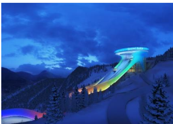
北京 2022 年冬奥会和冬残奥会张家口赛区张家口奥运村及古杨树场馆群建设项目-北欧中心跳台滑雪场（国家跳台滑雪中心雪如意）智慧照明系统及智慧夜游运营系统工程 EPC 总承包