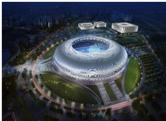
(成都)东安湖体育公园一场三馆项目泛光照明承包工程