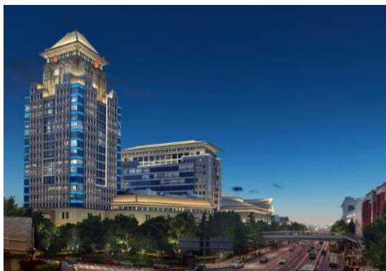
(北京) 中关村大街沿线夜景照明工程 (二期)