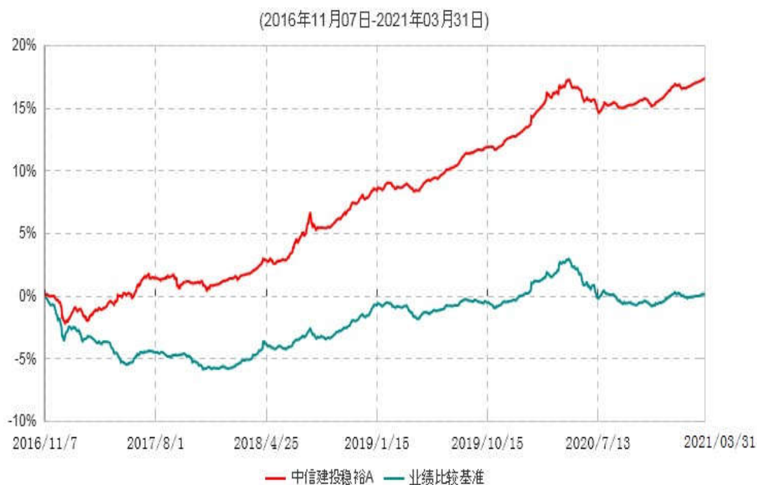
中信建投稳裕A累计净值增长率与业绩比较基准收益率历史走势对比图