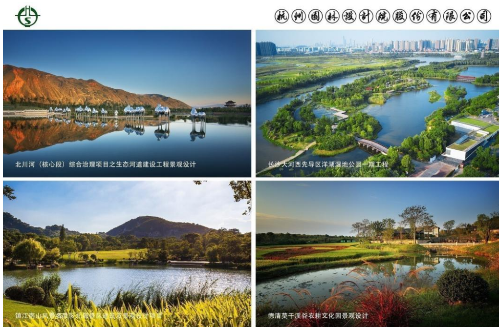
Hangzhou Landscape Architecture Design Institute Co.,Ltd.