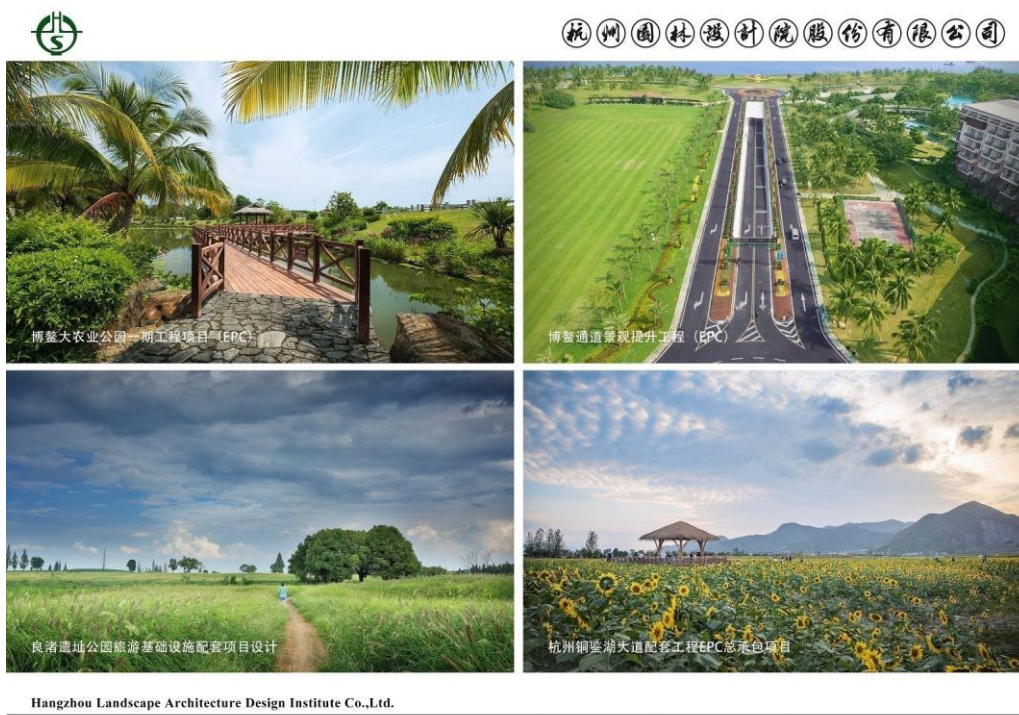
Hangzhou Landscape Architecture Design Institute Co.,Ltd.