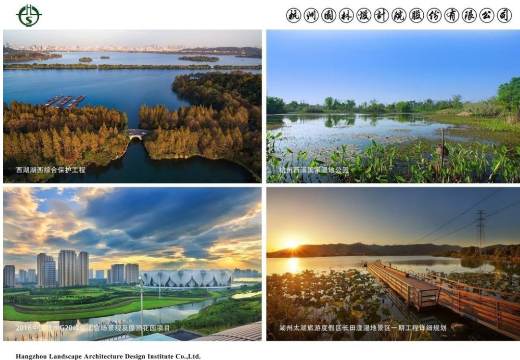
Hangzhou Landscape Architecture Design Institute Co.,Ltd.

公司风景园林设计业务以风景园林学、建筑学、城市规划学为核心，集成了以地质学、自然地理学、土壤学、气象学为代表的自然科学，以生物学、植物学、生态学为代表的生物科学，以园艺学、林学为代表的农业应用科学，以文学、艺术、美学为代表的人文科学，具有多学科综合交叉、多技术综合集成的典型特征。