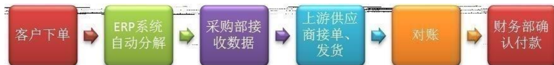
原材料采购下单流程

公司建立严格的原材料供应商备选制度，对原材料供应商的服务、规模、交货能力以及价格进行综合考评。公司原材料采购下单由微软ERP系统自动生成。销售部门接到客户订单后，ERP系统根据内部生产表设定原材料采购数量，并自动将数据分解后送至采购部，由采购部联系上游供应商下单。目前采购部门人员配备完善，工作职责定位清晰。在供应链管理方面，建立在双方信任和紧密合作的前提下，公司要求某些特定材料的供应商建设HUB仓制度（即原材料预先存放在公司的仓库，领用材料时才视同提货）。公司通过订单系统将建立HUB仓制度的原材料的日存货数据每日整理提交供应商，原材料供应商则根据HUB仓剩余的材料数量下达发货指令。HUB仓制度在采购流程上与普通采购流程无大差别，但在生产中更加有利于公司原材料提用和生产顺利进行。目前，采用HUB仓模式的主要是主材FCCL、屏蔽膜、化学品和部分通用元器件的供应商。