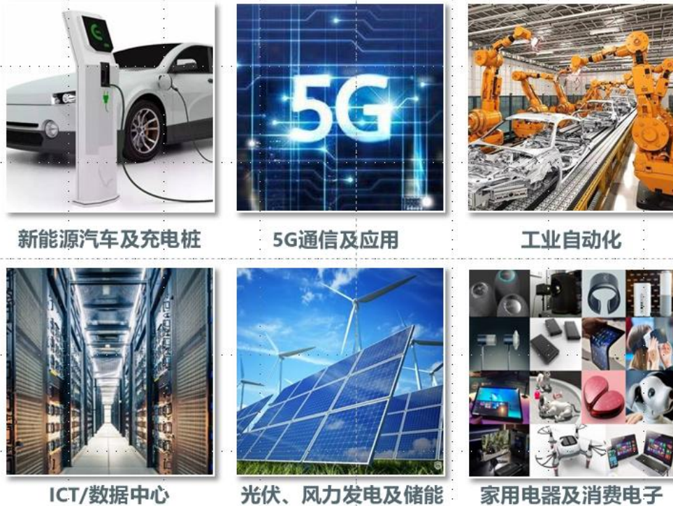
新能源汽车及充电桩