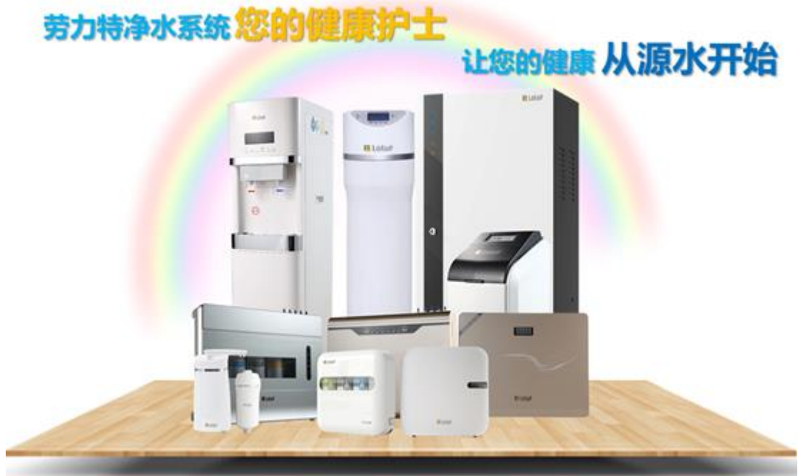
图7：“劳力特”净水系列产品

“劳力特”净水系列产品涵盖中央净水系统，解决入户端全屋用水净化问题；终端饮水系统，解决客厅等终端饮水问题；直饮水系统，解决厨房端直饮水处理问题；中央软水机系统，解决洗浴软水问题。公司净水系列产品可覆盖全屋前中后端用水需求，提供一体化健康用水方案，提升用户生活品质。