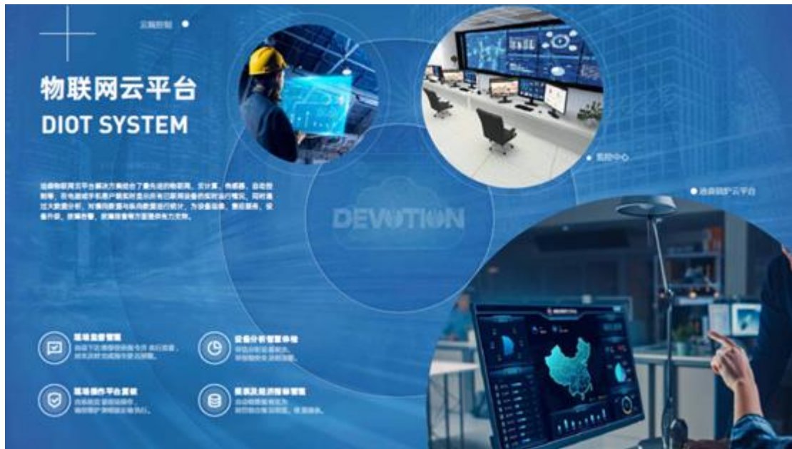
图3：物联网锅炉运营平台

迪森（常州）锅炉与阿里云携手共同打造物联网锅炉运营平台，结合了物联网、云计算、传感器、自动控制等，在电脑或手机客户端实时显示所有已联网设备的实时运行情况，可实现自动化数据采集、分析设备状态、监督现场操作、维修保养预警等服务，为不同需求的客户定制更智能、更节能、更环保的一体化热能解决方案。