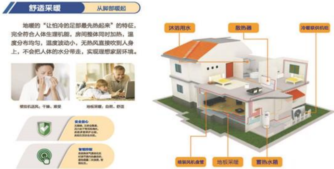
图6：空气源热泵机组供暖方案

“劳力特”净水系列产品涵盖中央净水系统，解决入户端全屋用水净化问题；终端饮水系统，解决客厅等终端饮水问题；直饮水系统，解决厨房端直饮水处理问题；中央软水机系统，解决洗浴软水问题。公司净水系列产品可覆盖全屋前中后端用水需求，提供一体化健康用水方案，提升用户生活品质。