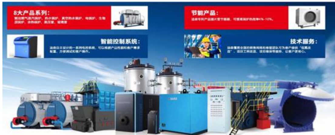
图1：迪森（常州）锅炉一体化热能解决方案

公司专注研发和制造清洁能源应用装备，主要产品覆盖燃油燃气锅炉、生物质锅炉、电锅炉、蒸汽发生器、余热锅炉、蒸压釜等。可为客户提供热力、蒸汽、采暖等多样化热能综合解决方案，拥有省市两级技术中心和热能工程研发中心，是燃气采暖热水炉、电加热锅炉技术条件，蒸压釜等多项国家及行业标准主编单位，并拥有工业4.0自动化机器人锅炉生产线，全面实现数字化下料、自动化焊接、标准化装配，整个生产过程质量可控，全新设计的冷凝锅炉系列产品，满足国家最新能效标准，最严苛超低氮排放要求，符合中国城镇化及燃气化进程，高效的分布式供热趋势及日益严格的环保标准，广泛运用于钢铁、化工、汽车、纺织、食品、医药、酒店等各个领域。