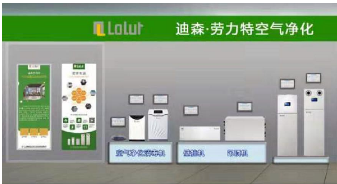
图5：劳力特空气净化系列产品

经国家空调设备质量监督检验中心检验，壁挂新风机（BS500）PM2.5净化效率可达99.7%，微生物净化效率可达97.3%；经广州市微生物研究所检测，劳力特空气净化消毒机白色葡萄球菌除菌率高达99.97%，H1N1病毒杀毒率高达99.99%。公司新风产品荣获由“共和国勋章”获得者钟南山院士亲自颁发的“南山奖”。