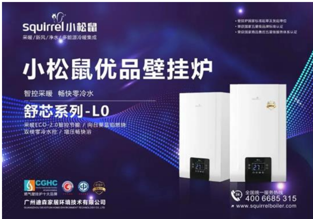
图4：舒芯系列-L0零冷水壁挂炉

“劳力特”新风系列产品可将室外空气净化除尘杀菌处理后送入室内，同时排出室内污浊空气，保持室内空气新鲜洁净健康，其搭载的定制冷热交换系统，可高效实现冷热能量回收，降低空气冷热量损失，同时还加强了多重过滤功能，可有效过滤PM2.5、静电集尘、花粉，可广泛应用于住宅、酒店、学校、医院等场所。