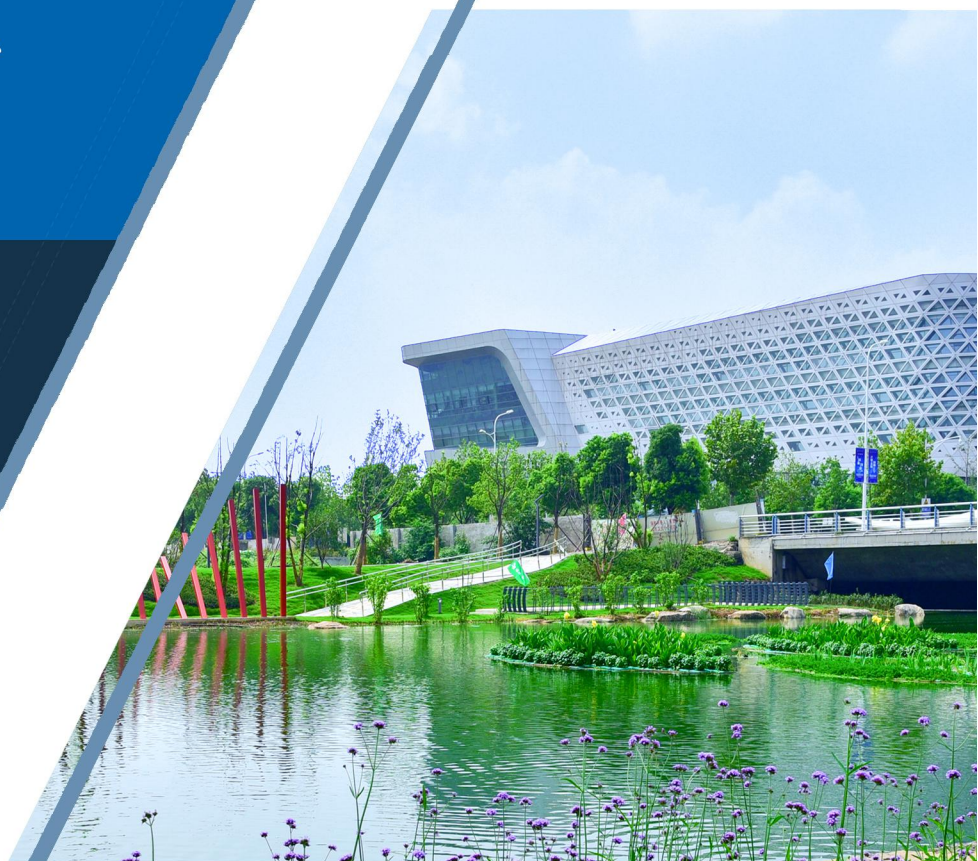
南京杨家圩水体治理与生态修复（“最美河道”实景图）