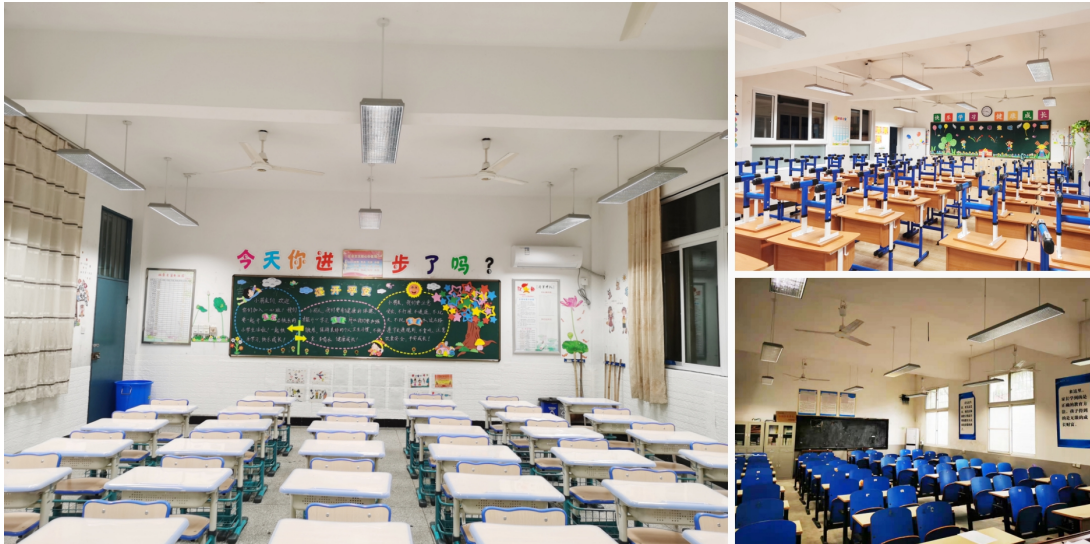
中小学教室照明改造解决方案