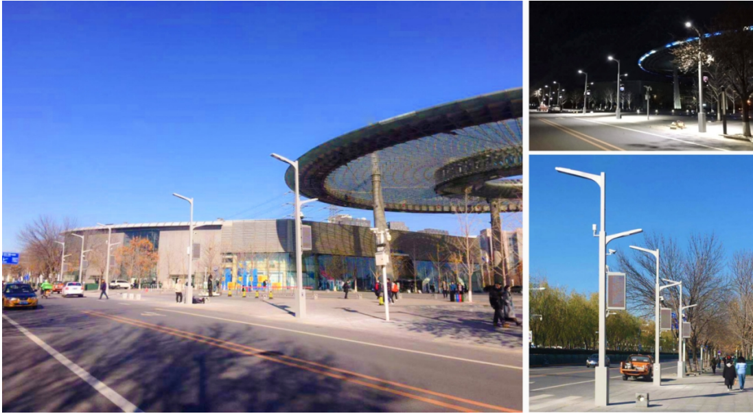
软件园智慧杆系统解决方案