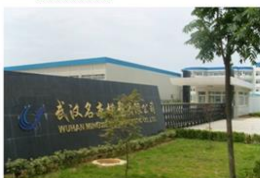
图 3：武汉名本模塑有限公司