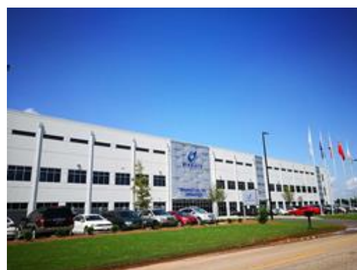
图 8：MingHua USA Inc.