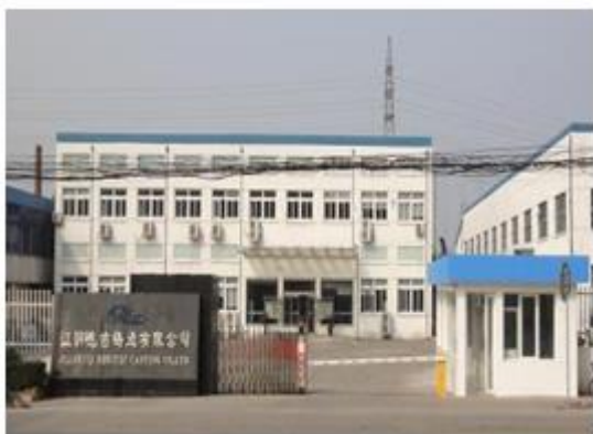
图 5：江阴德吉铸造有限公司