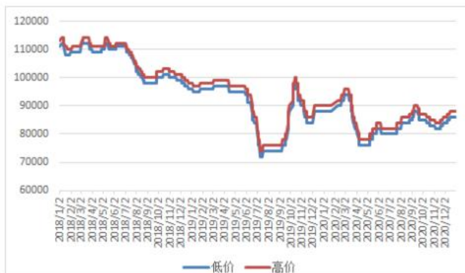
2018-2020 年国内钨精矿价格走势 (65%黑钨精矿, 单位: 元/吨) (数据来源: 安泰科研究资料)

报告期内, 面对新冠肺炎疫情冲击以及多变的国内外经济形势, 公司管理层在董事会的带领下, 在全球钨消费需求没有明显增长的情况下, 全年公司主营产品产量销量均有明显增长, 市场占有率进一步提升。碳化钨粉产量6225吨, 同比增长21.23%, 销量4983吨, 同比增长8.54%; 钨粉产量6232吨, 同比增长20.46%, 销售455吨, 同比增长10.55%; 硬质合金产量768吨, 同比增长213%, 销量443吨, 同比110%。