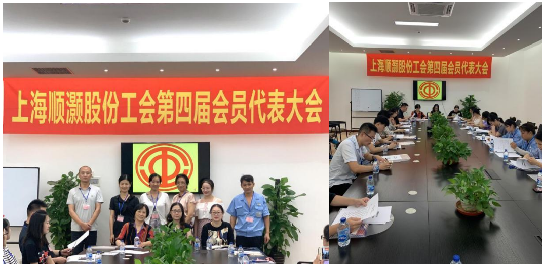
【工会会员代表大会现场】

9 月初召开的会员代表大会，根据《中华人民共和国工会法》、《中国工会章程》和《上海市工会条例》的有关规定，经过 36 代表选举，组成了新一届工会委员会。