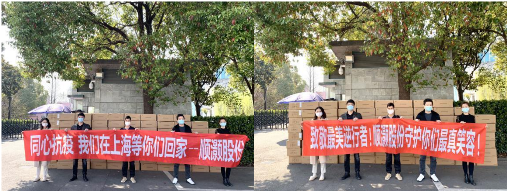
【致敬最美逆行者，顺灏股份向上海驻武汉医疗队捐赠一批慰问物资】