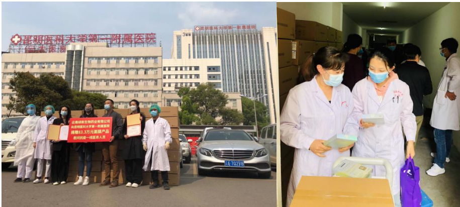
【顺灏股份联合子公司云南绿新向昆明医护人员捐赠一批慰问物资】