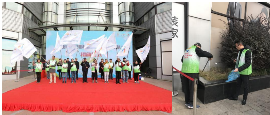
【顺灏股份参与“新时代·扬志愿精神，爱桃浦·建美丽家园”主题志愿日宣传活动】