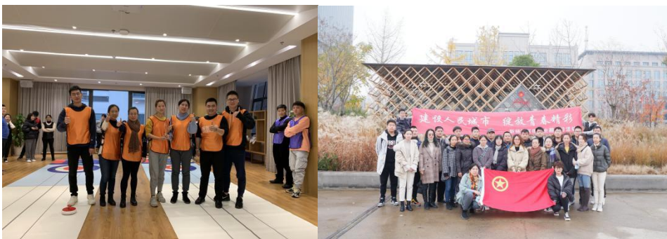
【顺灏党支部组织参加“建设人民城市，绽放青春精彩”2020年新杨园区主题团日】

各种社区或团队活动之外，公司以内刊《顺灏人》为企业教育和文化培育的阵地，加强与社区建设和文化生活的互动提升，从实际接触、相关活动参与到形成内刊文字表达，传