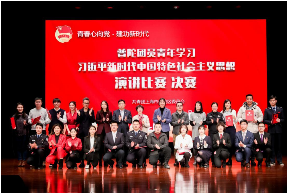
【“青春心向党·建功新时代”——普陀团员青年学习习近平新时代中国特色社会主义思想演讲比赛，顺灏股份企业代表进入决赛】