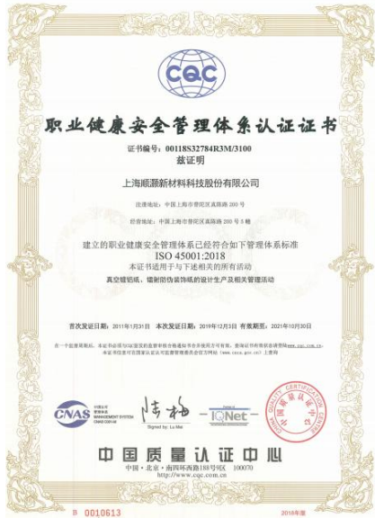
职业健康安全管理证书