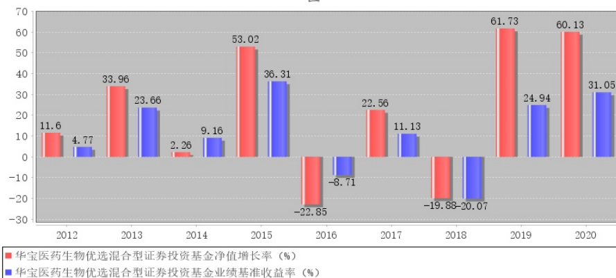
华宝医药生物优选混合型证券投资基金每年净值增长率与同期业绩比较基准收益率的对比图