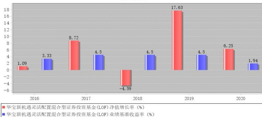
华宝新机遇灵活配置混合型证券投资基金(LOF)每年净值增长率与同期业绩比较基准收益率的对比图