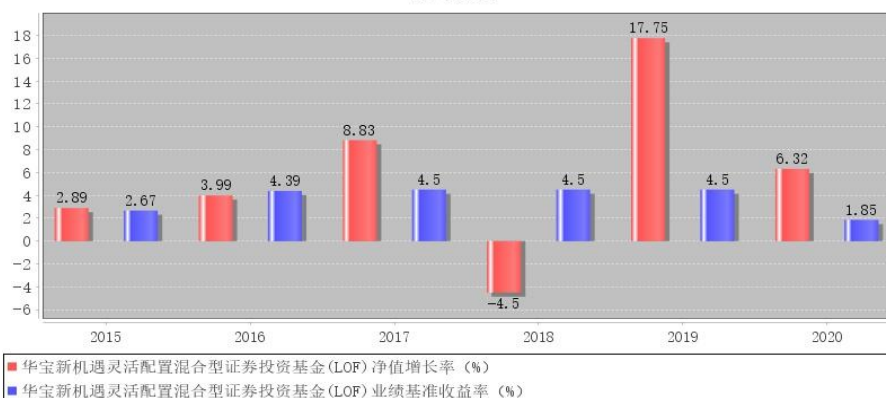
华宝新机遇灵活配置混合型证券投资基金(LOF)每年净值增长率与同期业绩比较基准收益率的对比图