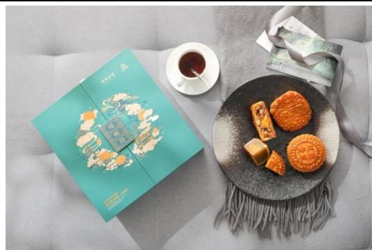
陶陶居“可听月”月饼