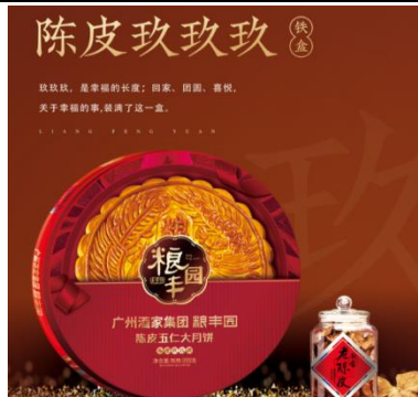
粮丰园陈皮五仁大月饼