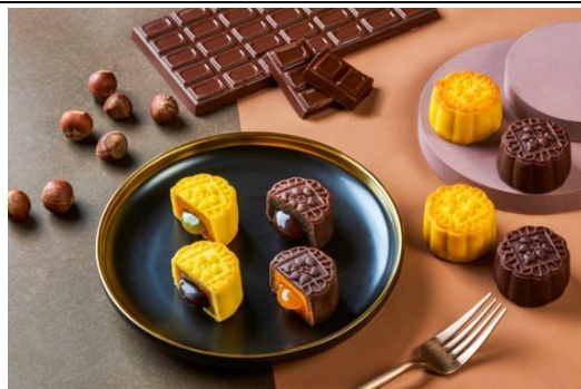
巧克力榛子流心月饼