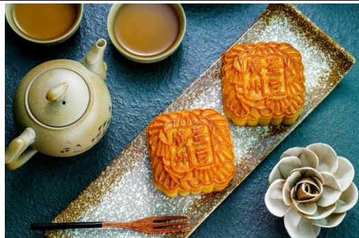
蛋黄果仁豆沙月饼