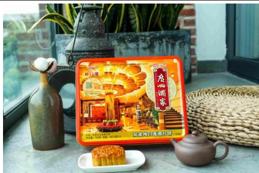
双黄纯白莲蓉月饼