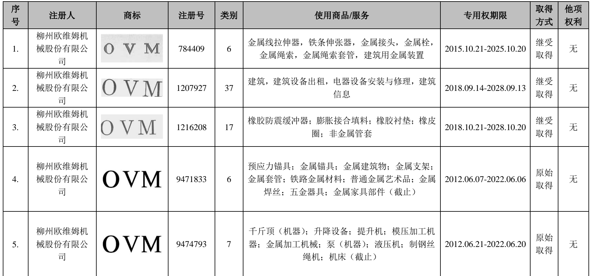
附表三：柳工有限及其下属子公司拥有的主要注册商标