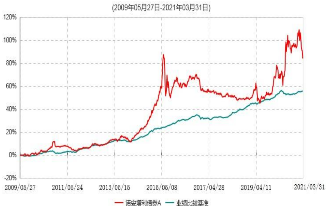
诺安增利债券A累计净值增长率与业绩比较基准收益率历史走势对比图