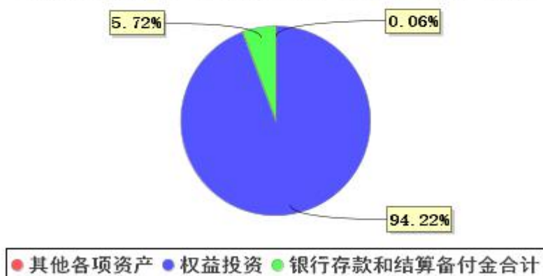
投资组合资产配置图表(2021年3月31日)