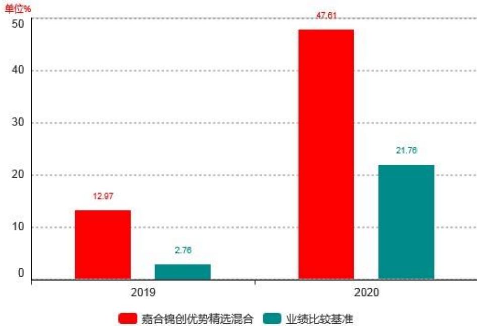
基金的过往业绩不代表未来表现，数据截止日：2020年12月31日

注：基金合同生效当年不满完整自然年度，按实际期限（2019年4月16日至2019年12月31日）计算净值增长率。