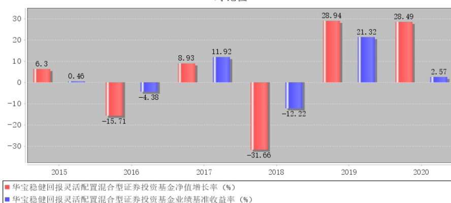
华宝稳健回报灵活配置混合型证券投资基金每年净值增长率与同期业绩比较基准收益率的对比图