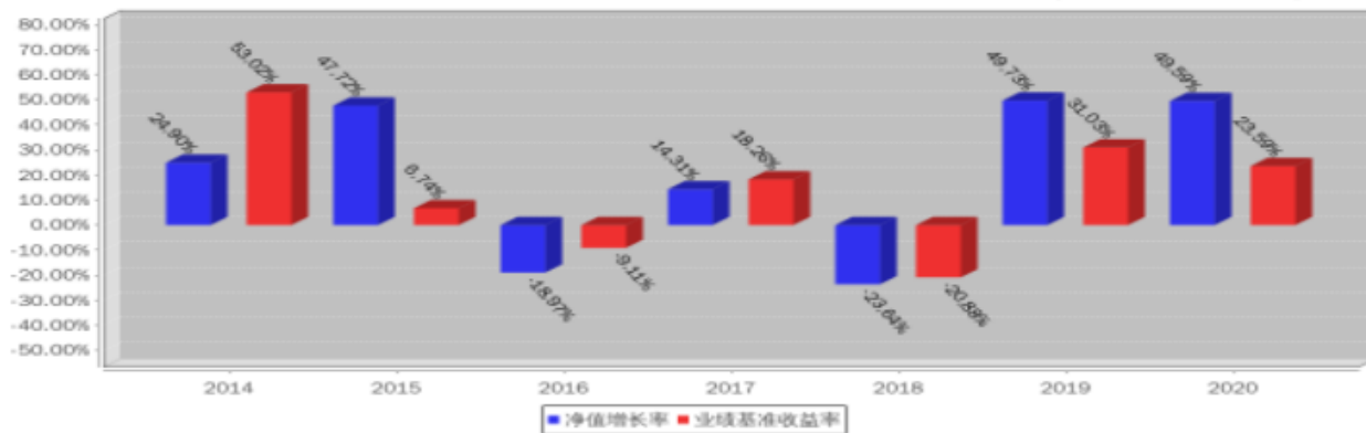
大摩进取优选股票基金每年净值增长率与同期业绩比较基准收益率的对比图(2020年12月31日)