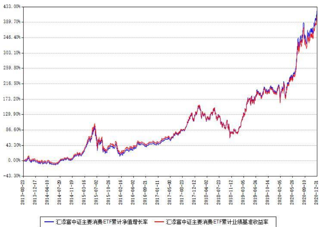
汇添富中证主要消费ETF累计净值增长率与同期业绩基准收益率对比图