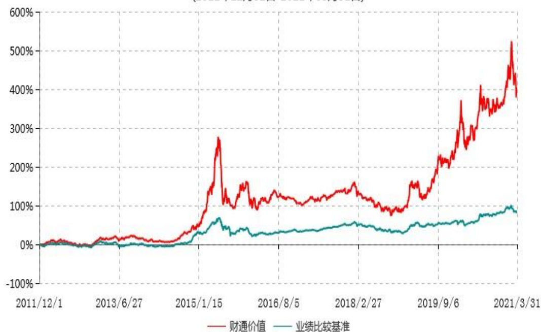
财通价值动量混合型证券投资基金累计净值增长率与业绩比较基准收益率历史走势对比图 (2011年12月01日-2021年03月31日)