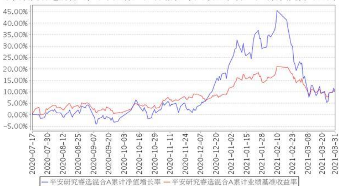
平安研究睿选混合A累计净值增长率与同期业绩比较基准收益率的历史走势对比图