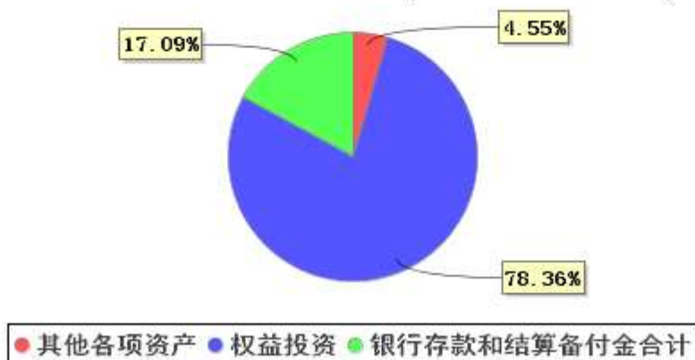
投资组合资产配置图表 (2021年3月31日)