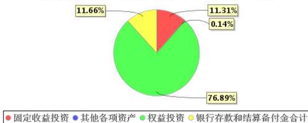
投资组合资产配置图表(2021年3月31日)