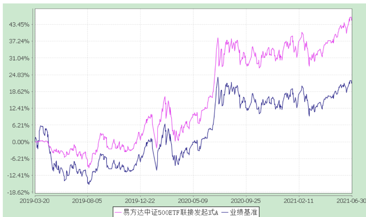
易方达中证 500ETF 联接发起式 C: