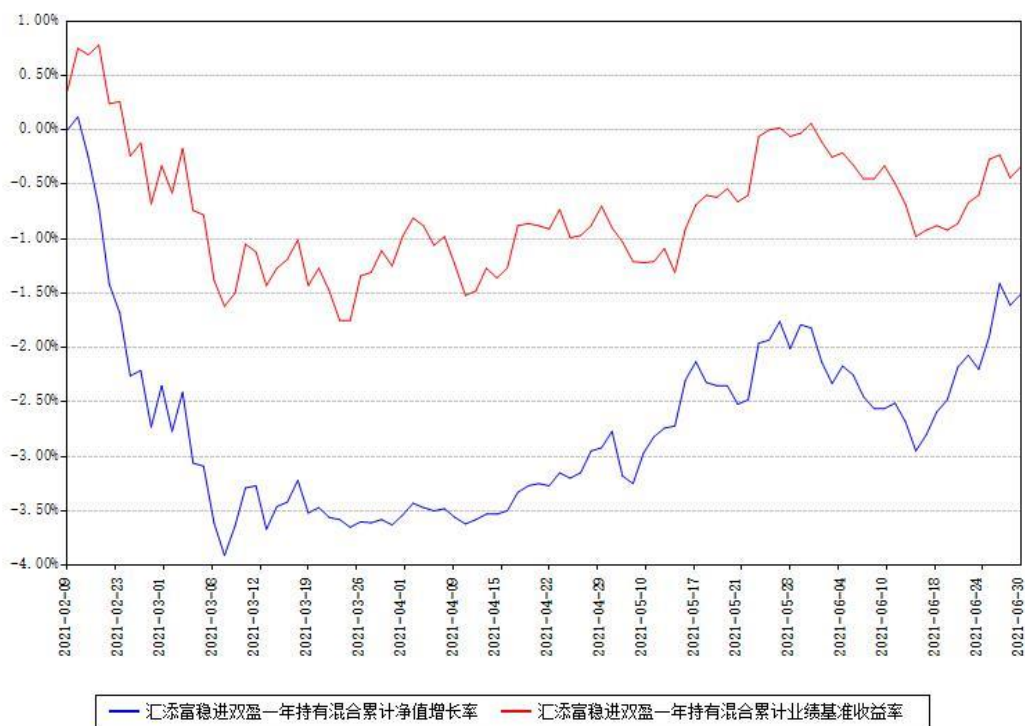
汇添富稳进双盈一年持有混合累计净值增长率与同期业绩基准收益率对比图