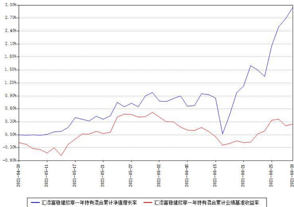
汇添富稳健欣享一年持有混合累计净值增长率与同期业绩基准收益率对比图