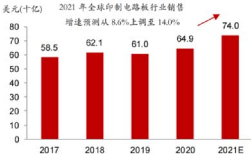
图表 PCB 行业规模变化