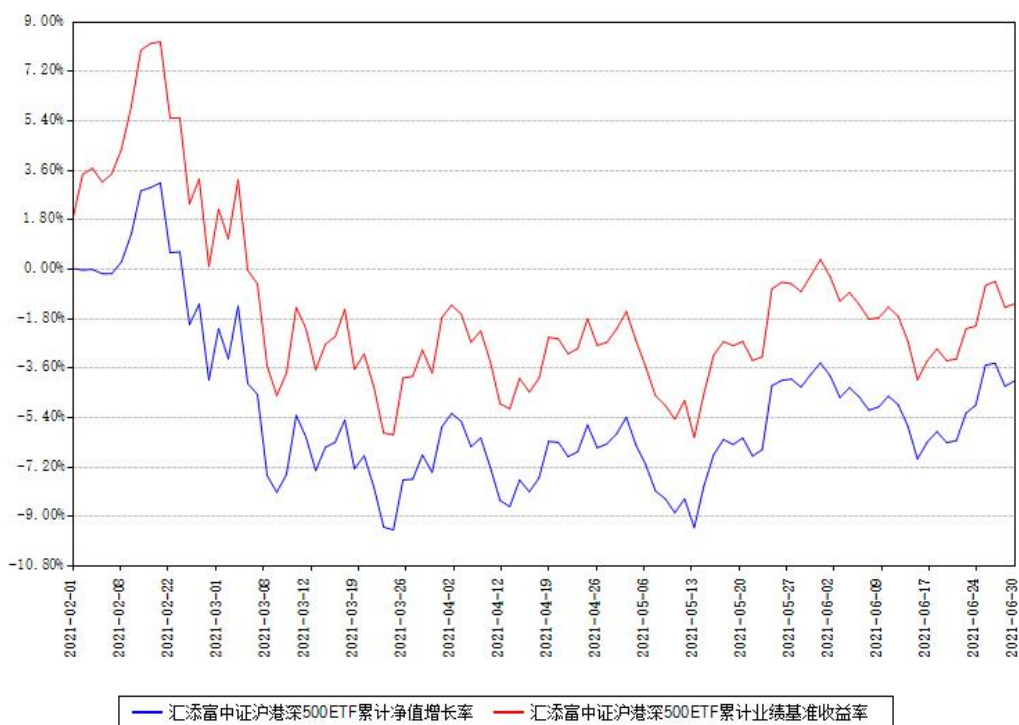
汇添富中证沪港深500ETF累计净值增长率与同期业绩基准收益率对比图