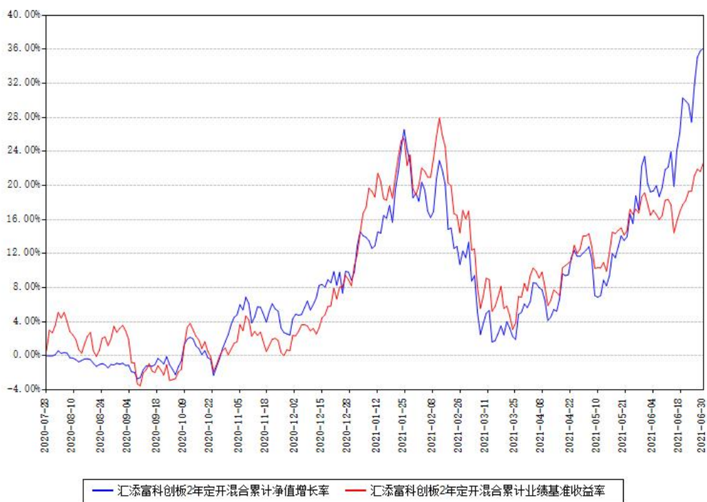
汇添富科创板2年定开混合累计净值增长率与同期业绩基准收益率对比图