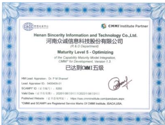
2020 年 8 月，公司研发水平通过 CMMI 五级认证。