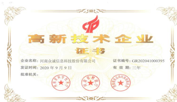
2020 年 9 月，公司再次被认定为高新技术企业。