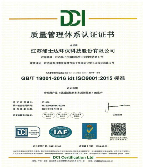
2021年2月3日取得质量管理体系认证证书。