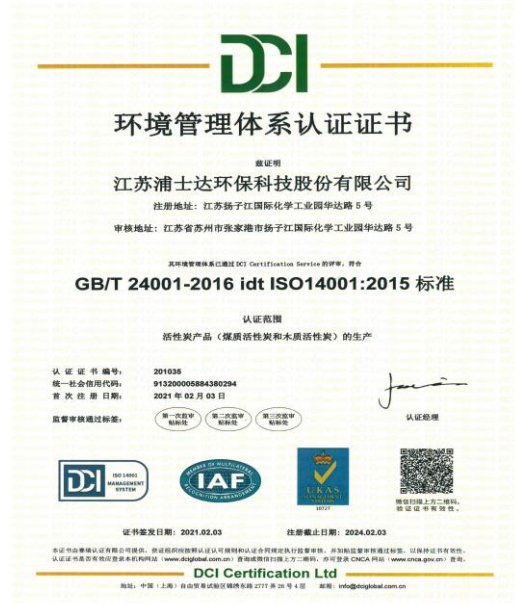
2021年2月3日取得环境管理体系认证证书。