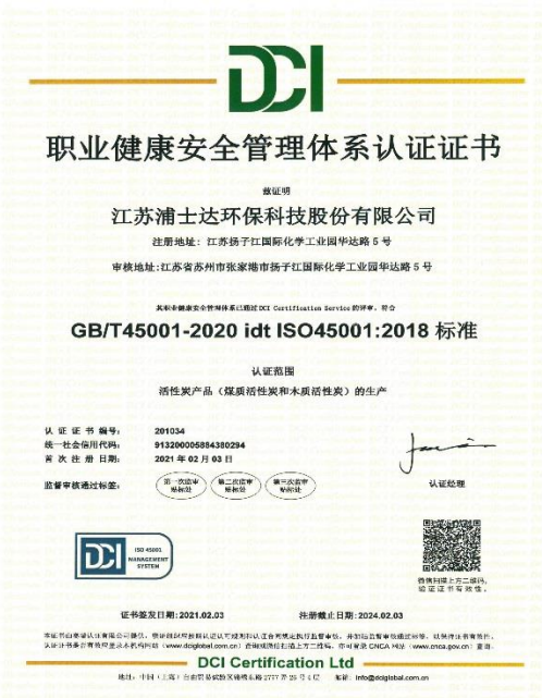
2021年2月3日取得职业健康安全管理体系认证证书。